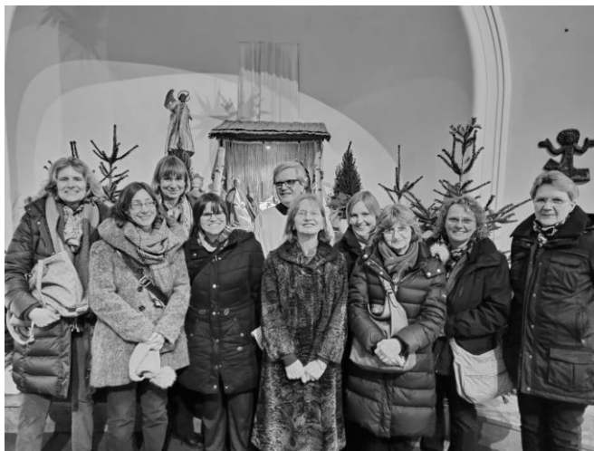
Die Gemeinschaft Missionares Identés mit einigen Gemeindemitgliedern

Wir freuen uns darauf Sie bald persönlich besser kennen zu lernen! Ihre Missionarinnen Identés.